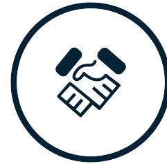
MEETING WITH CLIENTS