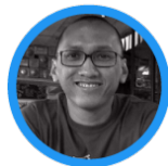
Prami Country Agency Lead, Google