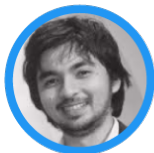
Waizly Darwin Chief Executive, Marketeers